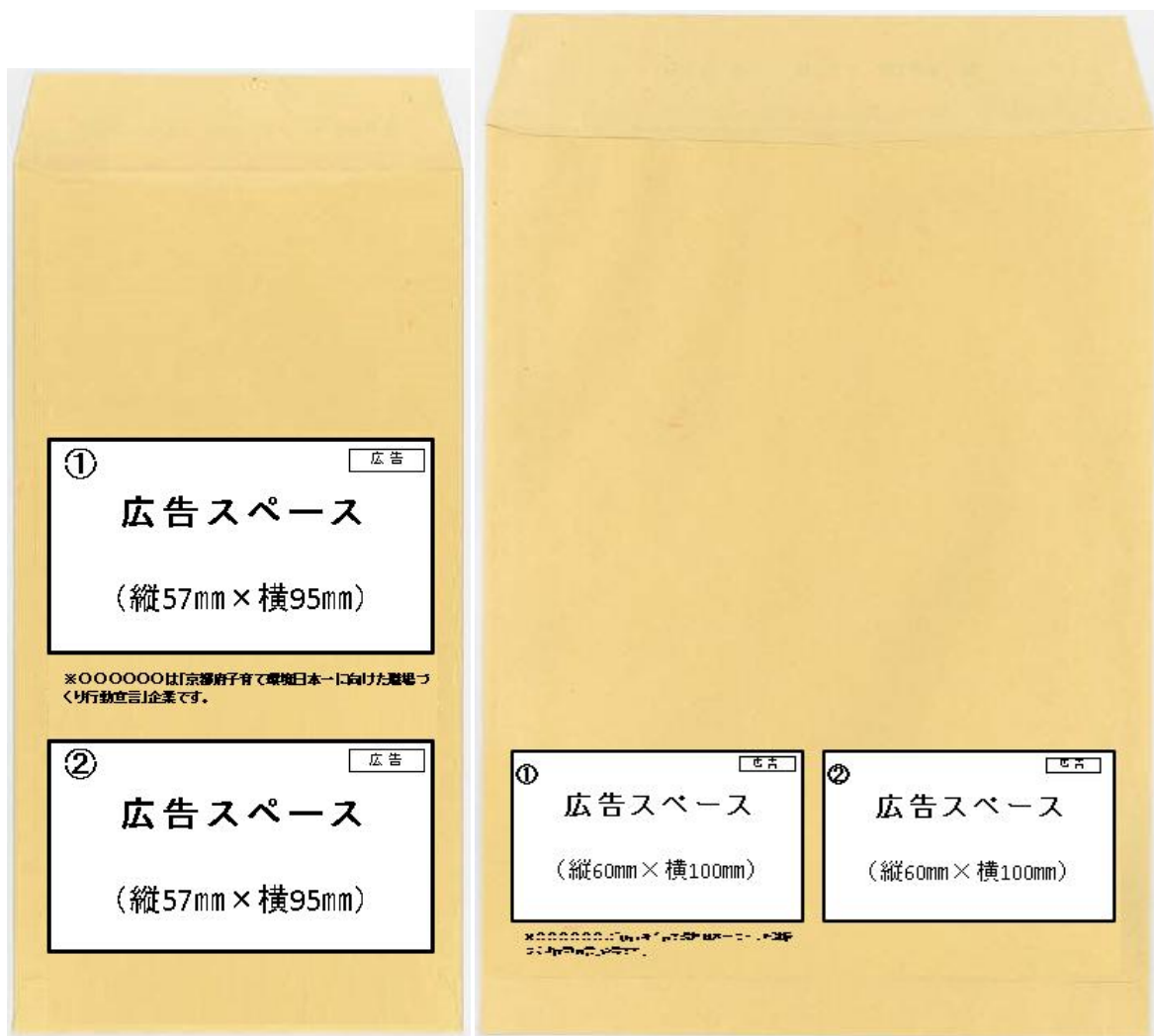
左：長 3 裏面/右：角 2・A 4 裏面