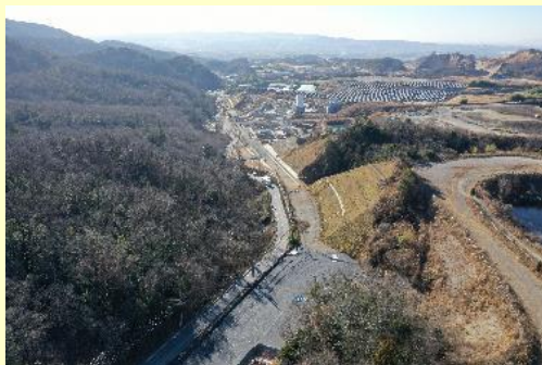
国道307号 市辺～奈島(城陽市)