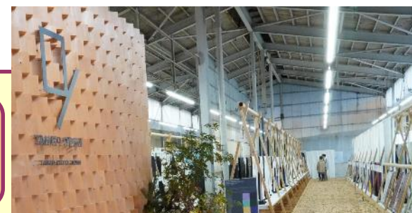
TANGO OPEN CENTER

丹後地域(TANGO OPEN CENTER)及び西陣・堀川地域を拠点として、世界的なシルクテキスタイルの総合産地を支援