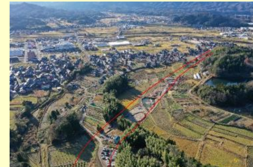
国道312号 大宮峰山インター線(京丹後市)