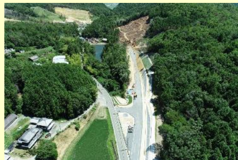
国道423号 法貴バイパス(亀岡市)