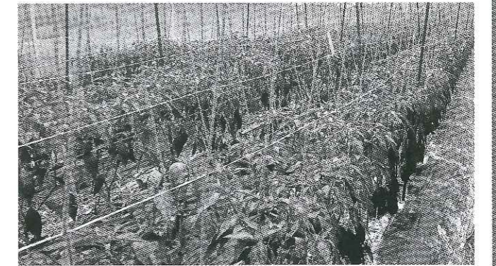
整枝・誘引直後の万願寺とうがらし

活着して苗の葉先に水滴が付くようになれば、かん水を控えて25~30℃に管理する。