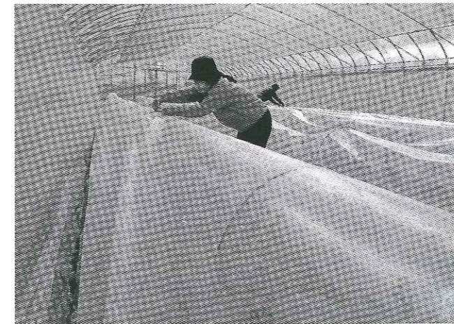
不織布で被覆した万願寺とうがらし