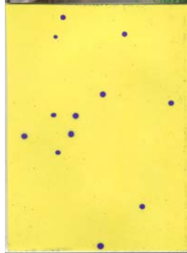
1 mm目合いネットの外