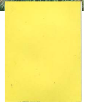
1 mm目合いネットの外