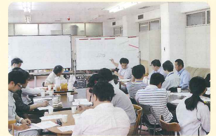
さし木研修会での講義

また、「さんさん山城」では、事業所内で栽培された農産物を使ったえびいもコロケや宇治茶濃茶大福の販売や、コミュニティカフェを整備するなど、地域の住民や農家と連携されています。普及センターでは、今後とも「農福連携」を技術面から支援していきます。