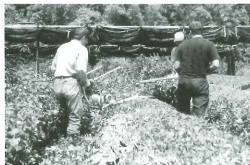
深刈り更新で樹勢回復

実施時期は一番茶摘採終了後、なるべく早いほうが望ましく、更新後、再生芽が5～6枚になった頃にせん枝面から5cm程度上で7月末までに刈り揃えましょう。