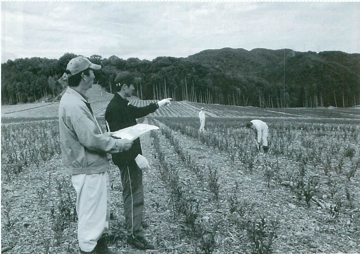
早期成園化に向けた作業を検討

地域の茶業を次代につなぐ基盤として、大きな期待が集まっています。普及センターでは早期の成園化に向けて、全面的に支援しています。