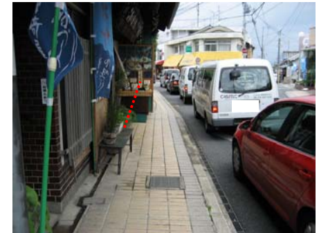
<南側から北側を望む>