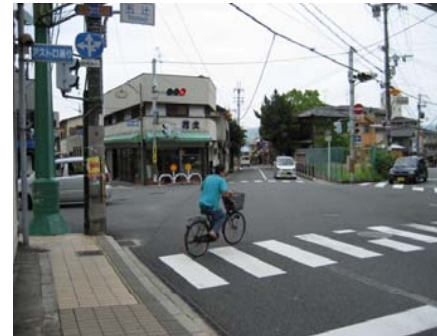
<南側から北側を望む> (五辻交差点)