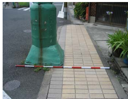
<アーケードの支柱> (道路占用物件)