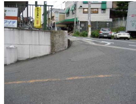
<南側から北側を望む> (歩道部段差改善の提案)