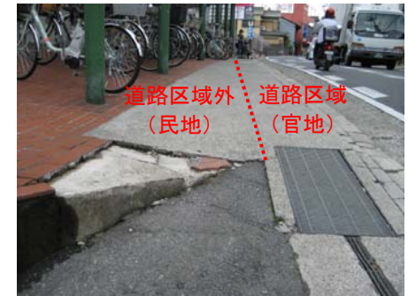
(歩道部段差改善の提案)