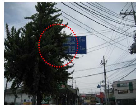
<南側から北側を望む> (植栽剪定の提案)