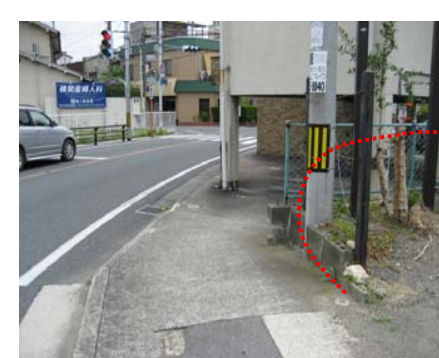
<西側から東側を望む>