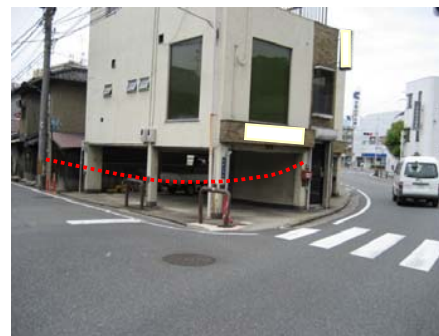
<東側から西側を望む>