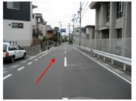
<北側から南側を望む>