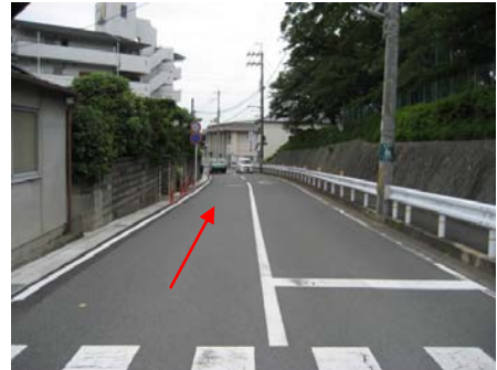
<北側から南側を望む>