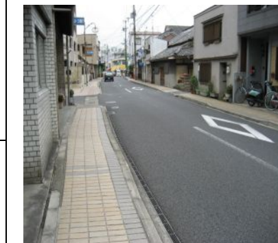
<歩道部の滑り止め対策> ■試験施工 約10箇所