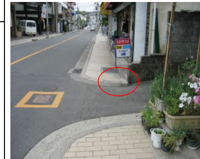
<縁石巻き込み部の水溜まり改善> ■排水施設の設置N=2箇所