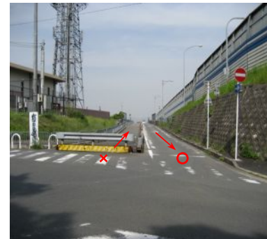
<区間の西端から東側を望む>