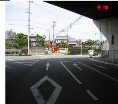
<交差点から府道(北側)を望む>