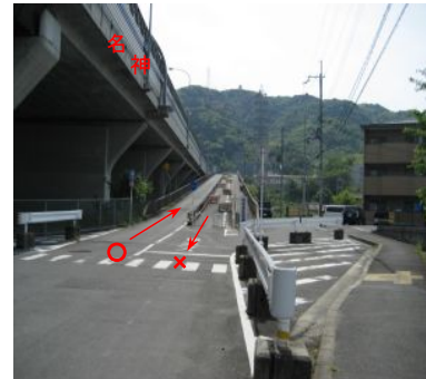
<区間の東側から西側を望む>

特記事項 対象区間は名神高速道路の拡幅建設用に設置された、道路(橋りょう)であり、現在は大山崎町道として、大山崎町が管理しているもの。