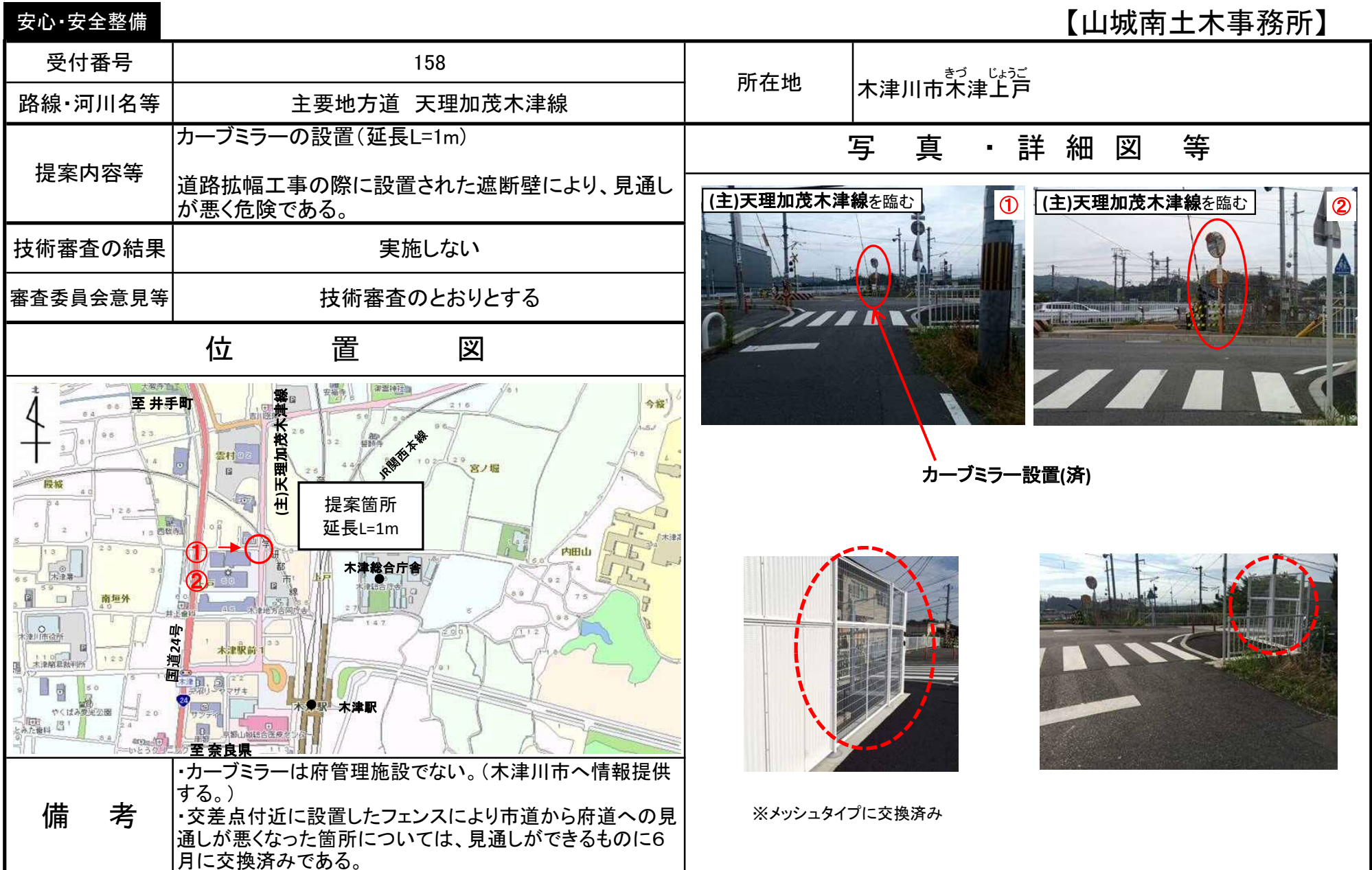
カーブミラー設置(済)