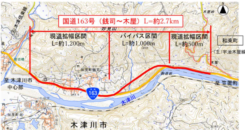
位 置 図