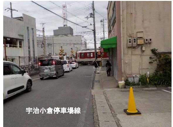
(向島第5号踏切付近)