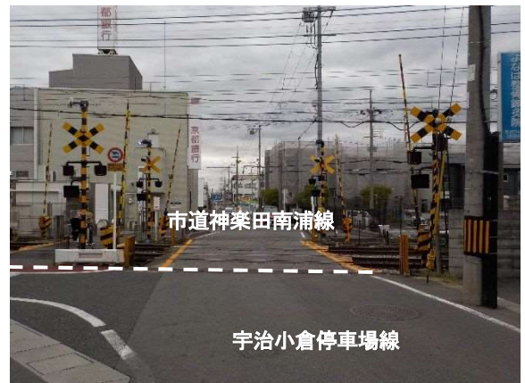
市道神楽田南浦線