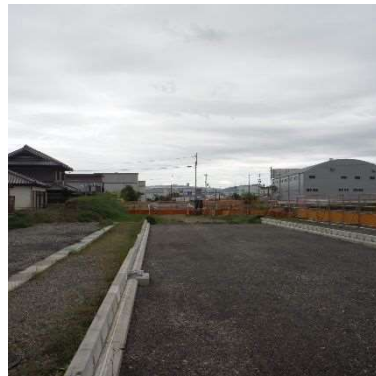
(市道蜻蛉尻西線交差付近)