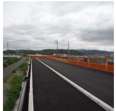
(市道二階堂川口2号線交差付)