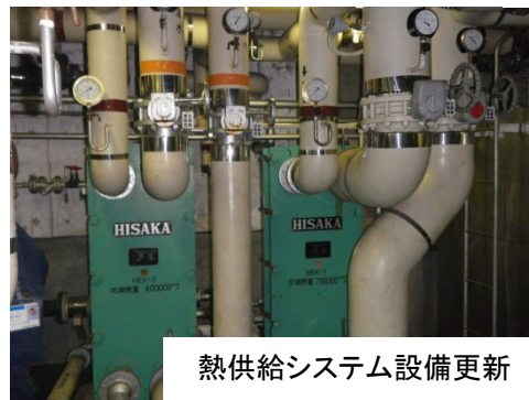
熱供給システム設備更新