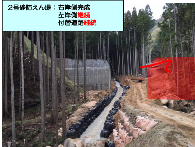
2号砂防えん堤：右岸側完成 左岸側継続 付替道路継続