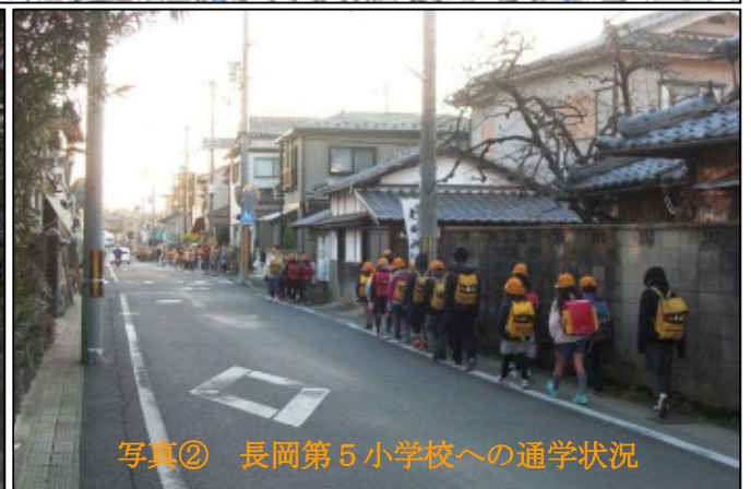
写真② 長岡第5小学校への通学状況