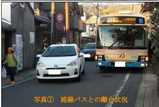
写真① 路線バスとの離合状況