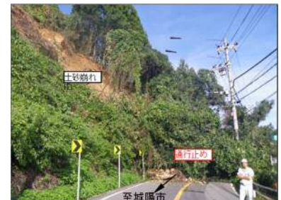
【被災の様子 平成25年9月】