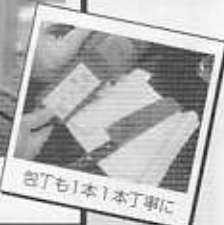
包丁も1本1本丁寧に

包丁から食品保管庫の取っ手まで、細菌や 汚染度(ATP)の検査試料を採取します。 食品そのものも、持ち帰ります。