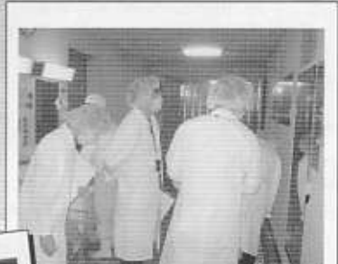
目視により食品を取り扱う 作業場の衛生状態をチェック