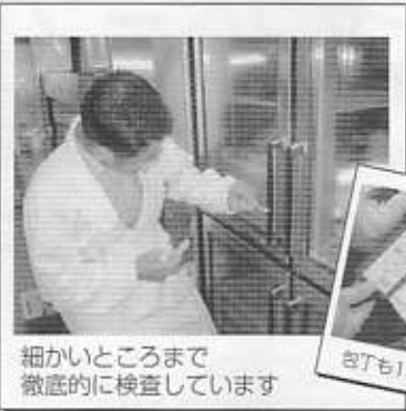
細かいところまで 徹底的に検査しています