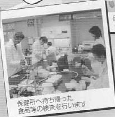
保健所へ持ち帰った 食品等の検査を行います