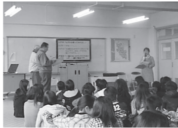
八幡市立くすのき小学校での授業風景（平成24年2月23日）

参加者からも「断り方がよくわかりよかった。」などの数々の声をいただいていますので、夏休み前の授業などで、ぜひご活用ください。