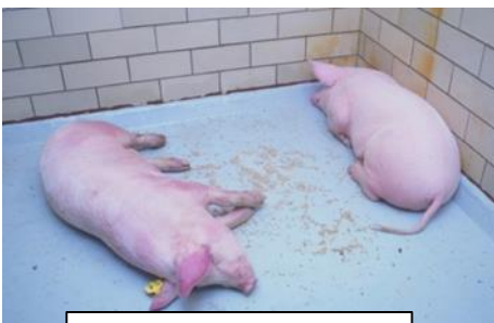
突然死やうずくまり

病状は多岐に渡り、甚急性、急性、亜急性、慢性の症状を示す。甚急性では突然死亡、急性では発熱(40~42℃)、食欲不振、粘血便、チアノーゼ等を呈し、死亡率は100%に近い。