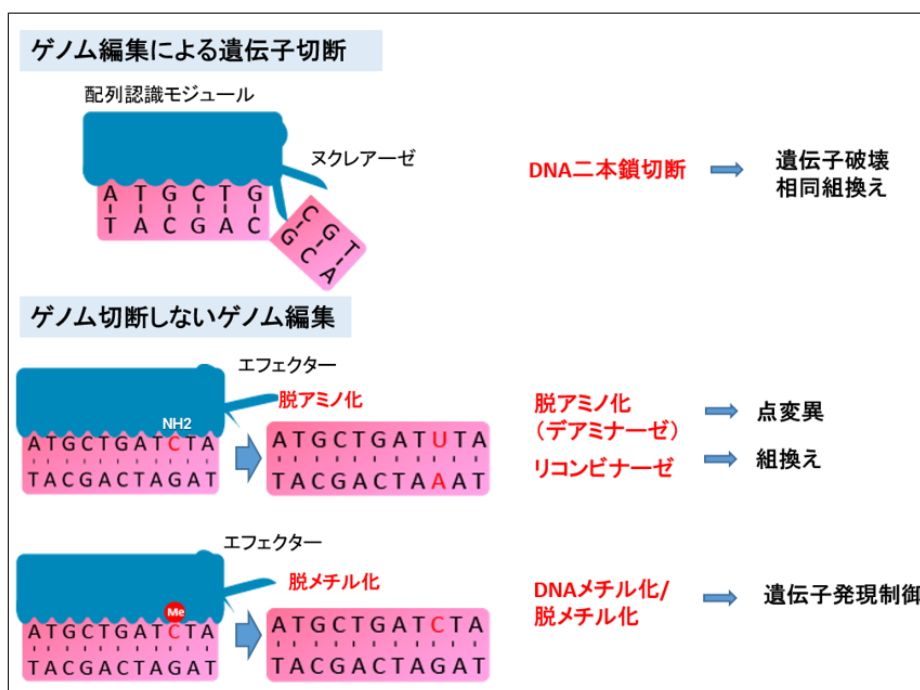
図3 ゲノム編集による遺伝子切断とゲノム切断しないゲノム編集

これらのDSBを起こさないゲノム編集技術についても、その持続性やオフターゲット作用による有害事象の可能性があり、遺伝子治療用製品としての品質や安全性評価が必要と考えられる。この場合、DSBを引き起こすゲノム編集の場合と同様に、細胞ごとにゲノムの改変の効率や特異性が変わり得ること、場合により改変された細胞の選別・純化等も必要になることを前提に品質評価を行う必要がある、さらに各遺伝子改変技術の内容に応じた最適な解析手法を用いて、使用する技術の妥当性を説明しなければならない。