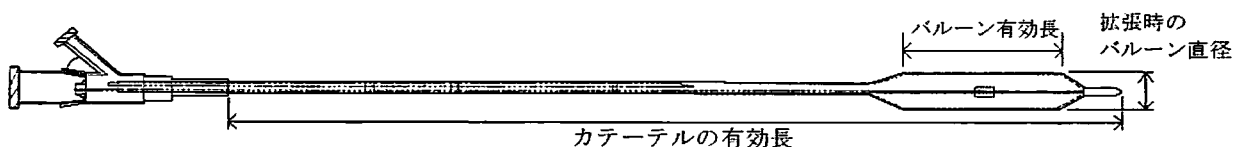
図 3. バルーン寸法の例

実使用環境を模した条件下で、適切な径のガイドワイヤーをカテーテル内に挿入するとき、ガイドワイヤーがガイドワイヤールーメン内を自由に可動することを確認する。