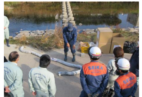
令和4年度実技講習の様子