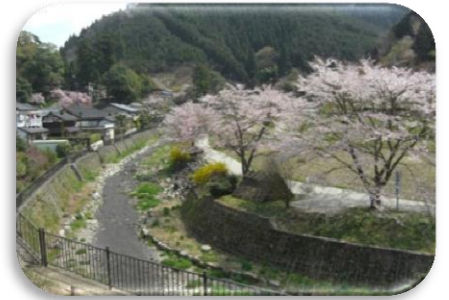
うぶやの里・大原

京の景観パートナーシップ制度は、景観資産の登録団体と大学、企業等が連携して地域の景観を守り育てる活動に取り組むもので、今回は制度創設後第1、2号の協定締結です。