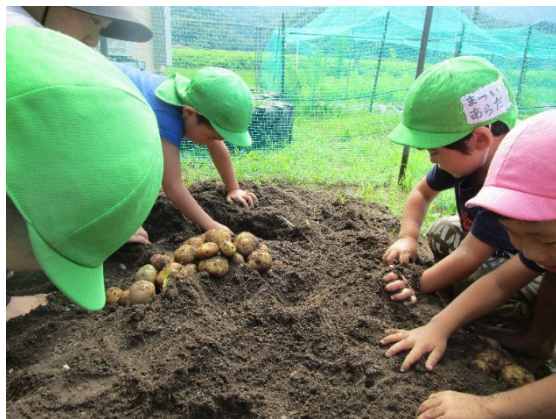
保育所での栽培収穫活動