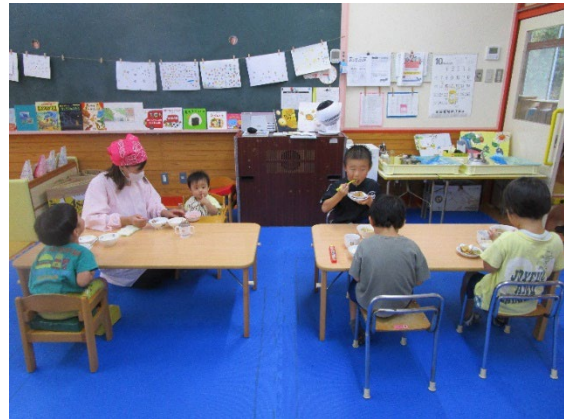
保育所での給食の様子