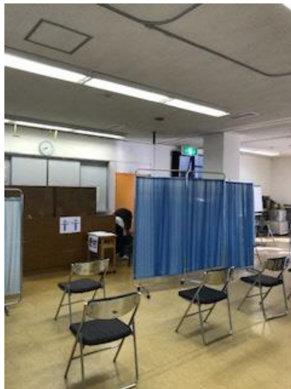
間隔を開けた待ちスペース の確保