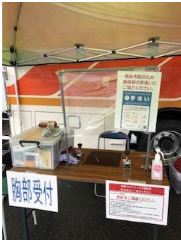
飛沫防止対策を実施した 受付