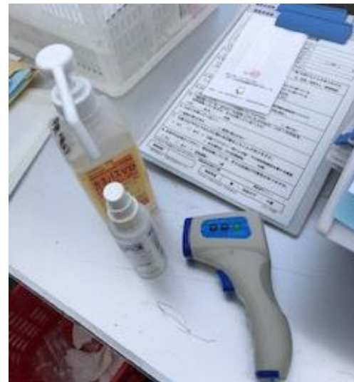
検温・消毒の実施