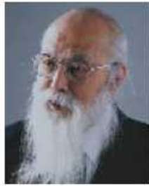
宇沢 弘文氏 経済学者 日本学士院会員 東京大学名誉教授

シカゴ大学教授、東京大学教授などを経て、現在、同志社大学社会的共通資本研究センター長、東京大学名誉教授、日本学士院会員、1983年文化功労者、1997年文化勲章受賞。著書：『経済学の考え方』（岩波書店）、『ヴェブレン』（岩波書店）、『経済学と人間の心』（東洋経済新報社）、『宇沢弘文著作集・新しい経済学を求めて（全12巻）』（岩波書店）ほか多数