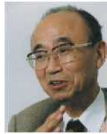
山折 哲雄氏 宗教学者

専門は環境経済学、財政学。開発が保全か、環境が成長かという二者択一の対立概念を越えた理論と政策、とりわけ持続可能な発展を実現する社会経済システムのあり方を追求。著書：『環境と経済を考える』（岩波書店）、『環境経済学への招待』（丸善ライブラリー）など