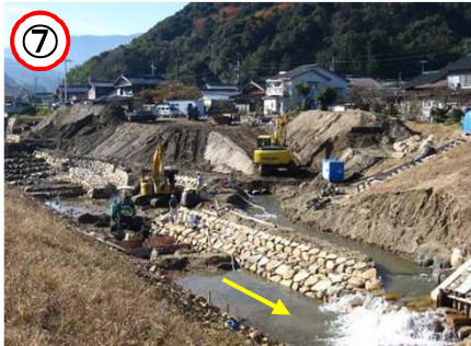
↑ 堂ノ下橋下流右岸側より親水広場を望む