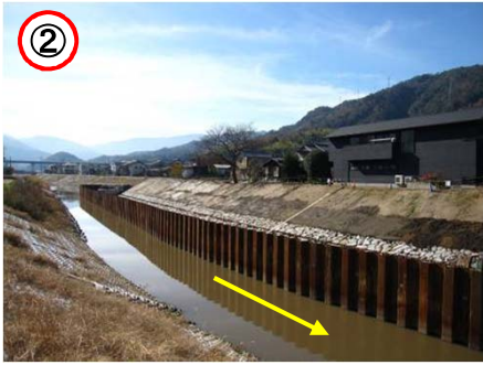
↑ 右岸側より上流を望む