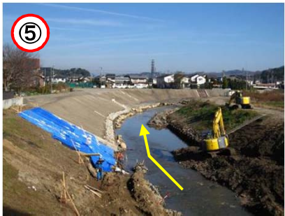
↑ 福田橋より下流を望む

百合が丘橋~福田橋 シグマ 拡幅・護岸工事 (~12/21) 福田橋下流 入柿水道 福田橋下流の護岸工事を進めています