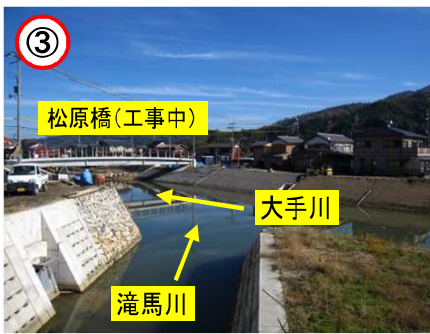
↑ 新松原橋方面から滝馬川と大手川の合流部を望む

滝馬川合流部 岸下建設 これまでの滝馬川と新しい滝馬川との合流部周辺を整備しています