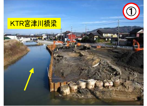
↑ 松原橋より下流を望む