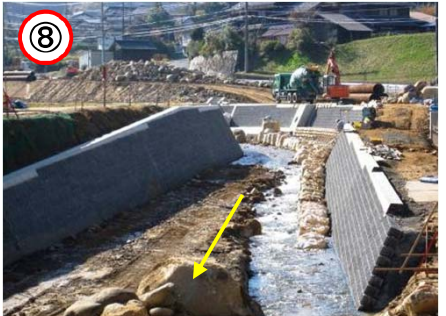
↑ 新中橋より上流を望む