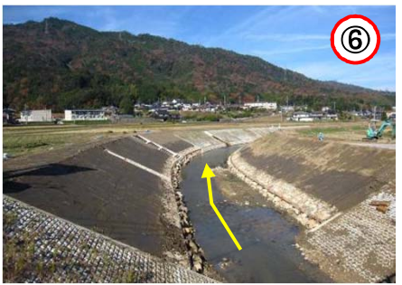
↑ 大橋より下流を望む