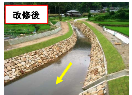
↑ 荒木野橋から今福川上流を望む