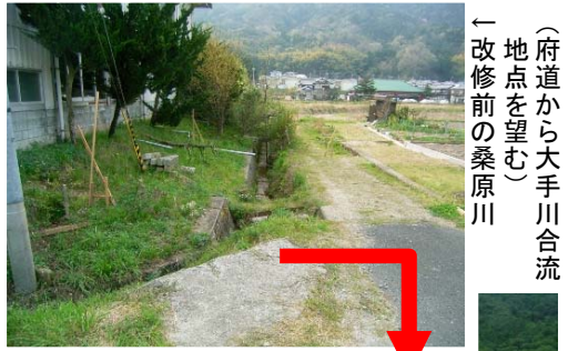
(府道から大手川合流地点を望む) ← 改修前の桑原川