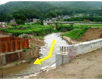
↑ 大橋より上流を望む 今福川合流地点