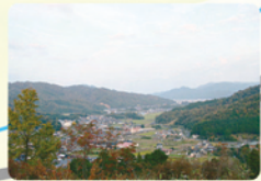
絶景ポイント②からの眺望 岩屋集落