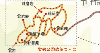
雲岩公園散策コース