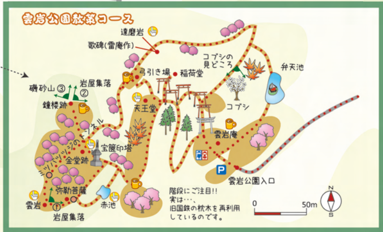
雲岩公園散策コース