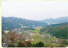
絶景ポイント①からの眺望 岩屋集落