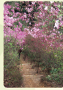
ミツバツツジのトンネル 毎年4月中旬に「つつじ祭」