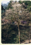
樹齢200年・目通り1.9mの コブシ 町指定天然記念物