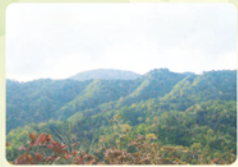
絶景ポイント③からの眺望 磯砂山