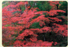
雲岩公園内紅葉風景