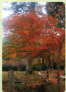
雲岩公園内紅葉風景