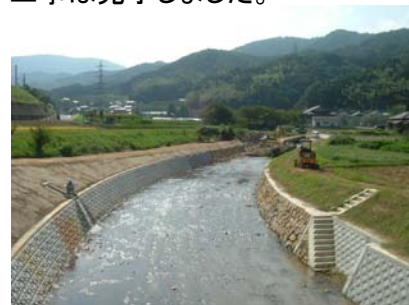
護岸工事(盛林寺橋上流) 宋徳建設 工事は完了しました。