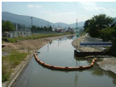
「中橋～京口橋」右岸の護岸工事 安田・入柿JV