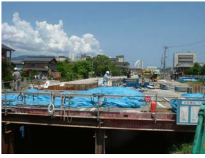
中橋架け替え工事 鶴見・永田JV