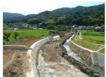
護岸工事(盛林寺橋上流) 宋徳建設