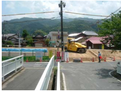
京口橋架け替え工事 金下・きしべJV 切替予定道路です。