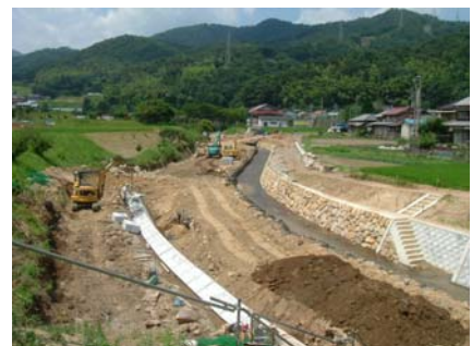
護岸工事(盛林寺橋上流) 宋徳建設