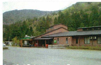
大江山グリーンロッジ (福知山市)