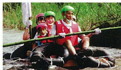
自然体験 (風のがっこう京都・京丹後市)