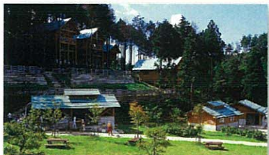
キャンプ (大内峠一字観公園・与謝野町)