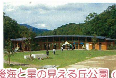
丹後海と星の見える丘公園 (宮津市)