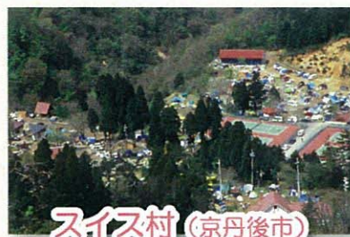
スイス村 (京丹後市)