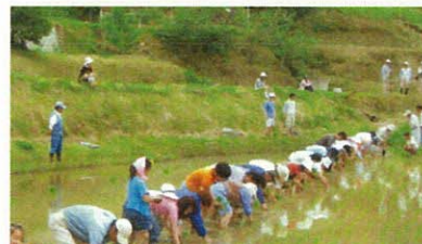
棚田保全 (毛原・福知山市)