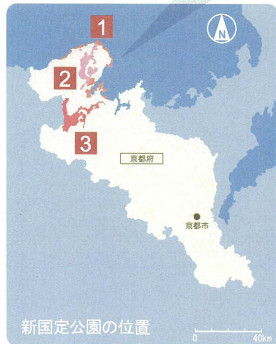
新国定公園の位置

大江山連峰地区は丹後半島の南に位置し、標高600m～800mの稜線が東西に連なっている連山地形です。連山の山頂からは360度の視界が広がるパノラマ景観や稜線からの山間景観、鬼嶽稲荷神社から見る雲海など、さまざまな自然風景を見ることができます。