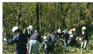
里山利用 (上世屋・宮津市)