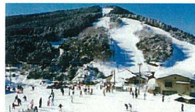
スキー (大江山スキー場・宮津市)