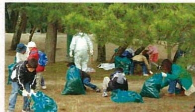
松並木保全 (天橋立・宮津市)