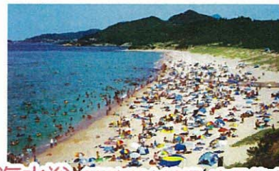
海水浴 (掛津海水浴場・京丹後市)