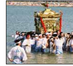
祭り最大の見せ場「本みこしの海上渡御」

京丹後市網野町の夏を彩る「水無月祭」のようすです。夏は海水浴、冬はカニなど海の幸を求めて多くの観光客が訪れ、付近の道路は混雑します。