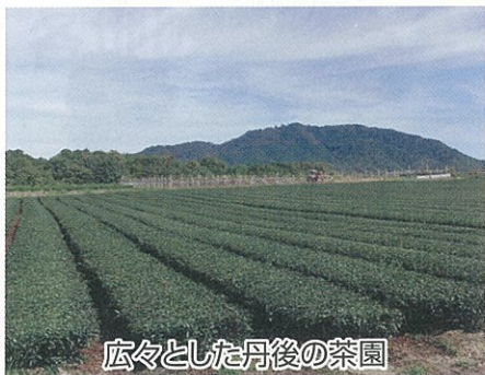
広々とした丹後の茶園