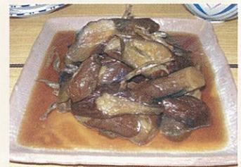
うみゃあで。食べなれ。