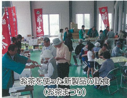
お茶を使った新製品の試食(お茶まつり)

茶生産農家の念願であった製茶工場が今春完成し、丹後での茶生産が本格的に始まりました。また、地域初の大型茶工場を住民の皆さんに紹介する「丹後お茶まつり」(6月20日開催)では、850名もの地元の方々が新茶の試飲をはじめ、お茶の入れ方等を体験されました。