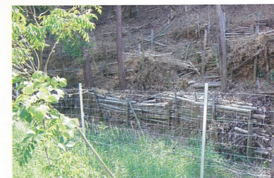
バッファゾーンとフェンスの設置

滝・金屋ではシカ、イノシシによる被害を皆無にするために、安全防護柵（金網フェンス）とバッファゾーン（田と山を棲み分ける緩衝帯）の整備が行われました。地区の山林と農地の境界に高さ約2m、総延長約2600mのフェンスを設置し、フェンスの山側の雑木や雑草を刈り払うことで、獣の隠れ場所がなくなり侵入するときにプレッシャーを与えるなど複合的な効果が期待されます。今後はこのバッファゾーンの維持管理を図っていくことが課題となります。