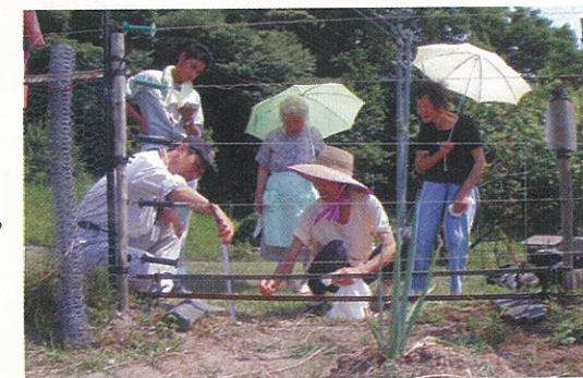
矢畑地区のモデルほ場

矢畑では特にサルの被害に困っています。楽しみに作っている野菜や栗やしいたげがサルにやられるほど被害が深刻化しています。サルによっておばあちゃんが怪我をする事故も起きています。そんな中、今ある電気柵にひと工夫を加え被害を軽減できる方法を検討し、柵を設置しました。また、獣害に遭いにくい作物として、とうがらし・ごま・ごぼう・こんにゃく・ふき・こぎく等を普及センターから提案し、栽培を進めています。