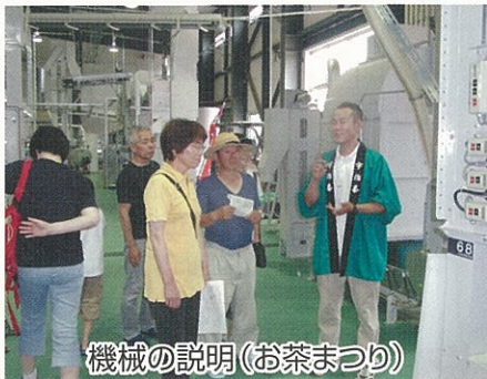
機械の説明(お茶まつり)