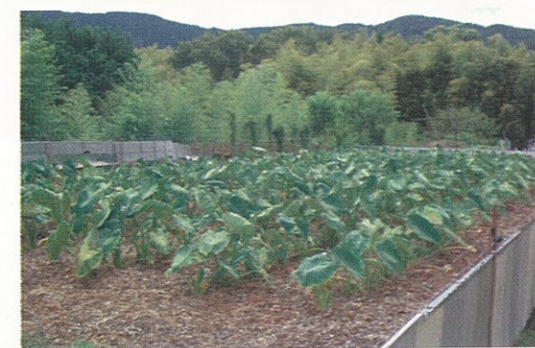
日ヶ谷地区のモデルほ場

日ヶ谷では里力再生事業に取り組み、直売所向けの農林産物や加工品づくりが活発になっていますが、その一方、サルに代表される獣害が顕著であるため農作物への被害があいつぎ、生産意欲が減退しています。そこで、丹後地域野生鳥獣被害対策チームと連携し、サルから農作物を守る実証ほの設置を行いました。実証ほの被害の有無、程度を調査し今後につながる活動にしたいと思っています。