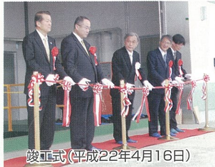
竣工式(平成22年4月16日)