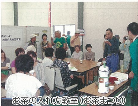
お茶の入れ方教室(お茶まつり)