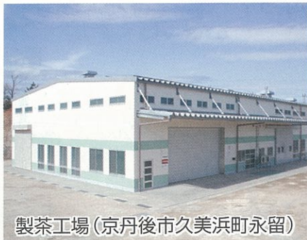
製茶工場(京丹後市久美浜町永留)