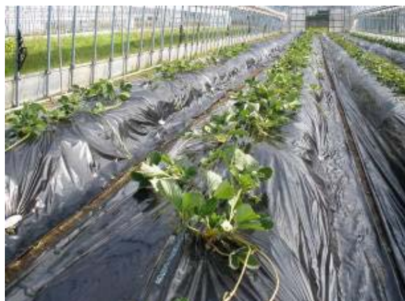
イチゴの花が咲きました。