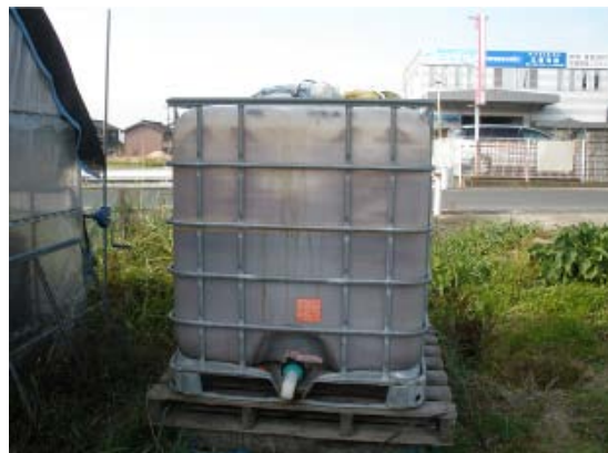
自信の液肥製造器