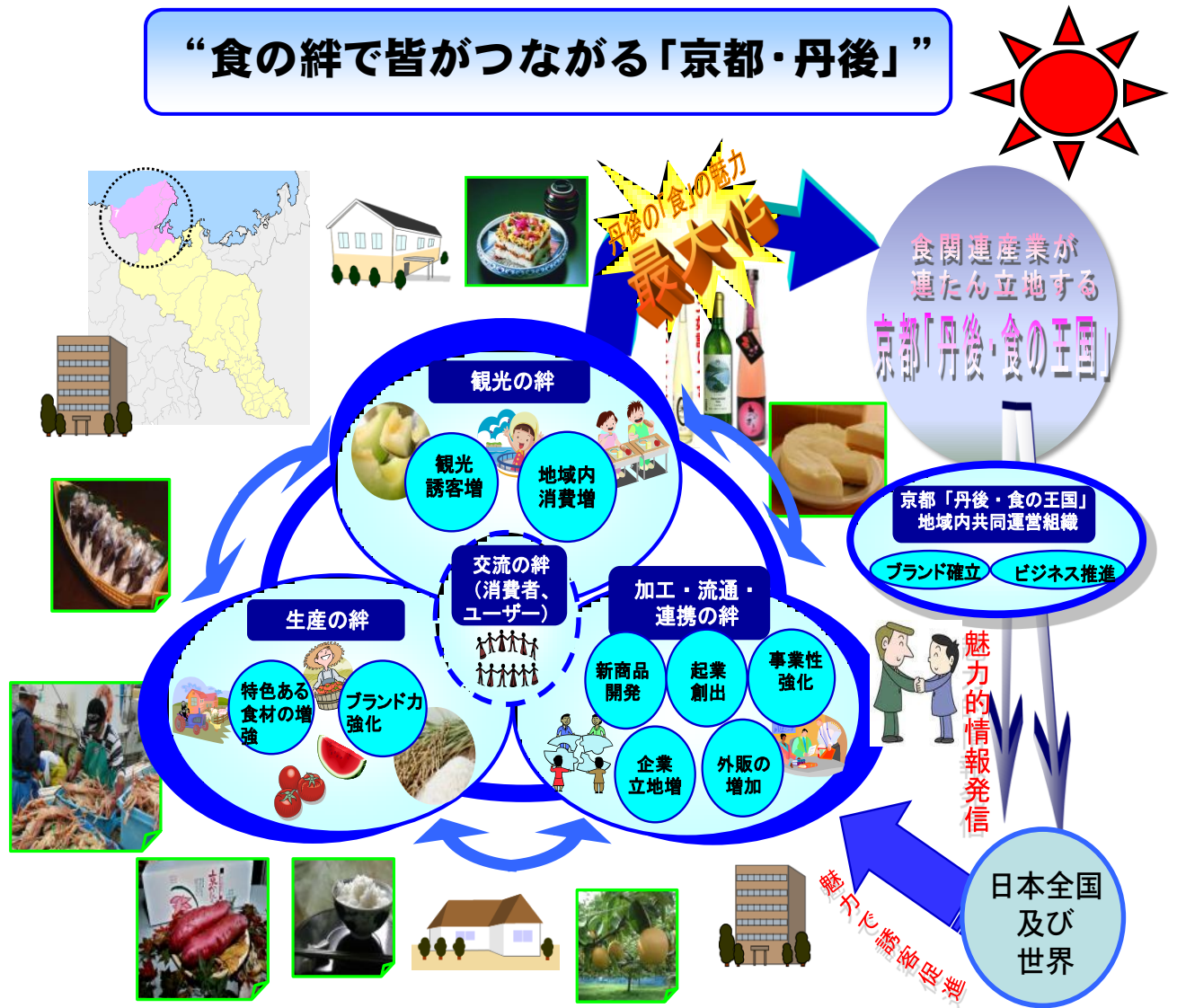
京都「丹後・食の王国」の完成イメージ図

の6つの絆で、食関連産業の「環」となつてつながることによって、丹後の「食」の素晴らしさが全国、ひいては世界に広まり、丹後地域全体の魅力が最大化される姿を目指しています。