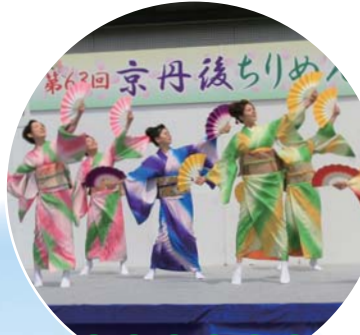
文化ステージ (芝生広場)