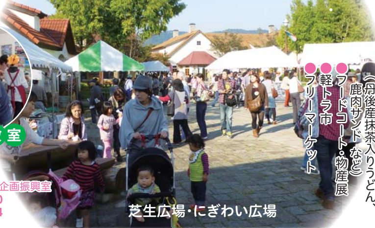
芝生広場・にぎわい広場

問 丹後広域振興局企画振興室 TEL 0772-62-4300 FAX 0772-62-5894