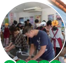
魚料理教室 (道の駅)

問 丹後広域振興局企画振興室 TEL 0772-62-4300 FAX 0772-62-5894