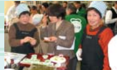
▲試食会には旅館経営者の方など約50人が参加 農林商工部商工観光室 TEL.0772-62-4304