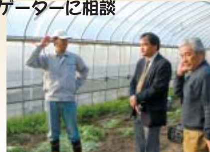
▲定住プロセス、田舎ぐらしの心得など、さまざまな視点からナビゲーターがアドバイス

丹後でも、農のある暮らしフロンティア推進事業の登録農園利用者の一人で、近い将来、丹後に定住したいと考えている方から、ナビゲーターが相談を受けられました。