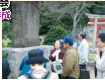
丹後広域観光キャンペーン協議会事務局 (商工観光室内) TEL.0772-62-4304 http://www.tangokankou.jp/

丹後に訪れた観光客の方々が、地図を片手にぶらぶら歩き、何気ない風景や人とのふれあい、食べ歩きもできるKTR駅等を起点にした散策マップを作成しています。 コースの設定にあたっては、地域の方や観光ガイドに参加いただき、新たな魅力の掘り起こしを行うとともに、地域の良さを再認識していただきました。