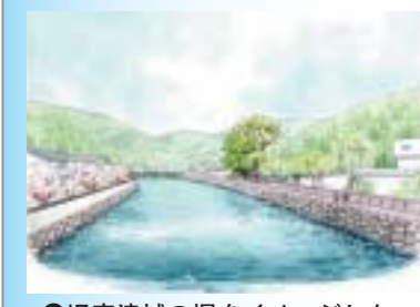
●旧宮津城の堀をイメージした下流部護岸整備

◀大手川の改修では、「宮津の歴史と自然を生かした安全で、心やすらぐ水辺づくり」を目標に、護岸構造の検討や遊歩道の整備等について、みなさんで考えていただくワークショップを開催しました。