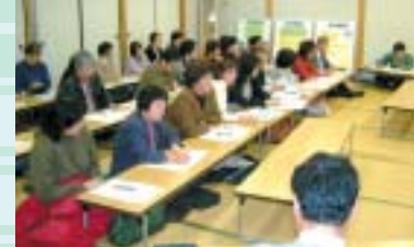
▲エコファーマー、消費者、流通業者の三者による座談会を開催 農林商工部企画調整室 TEL.0772-62-4315