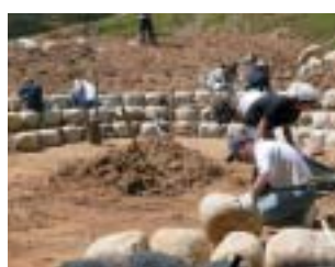
▲建設中の石積み劇場

みんなで公園を作る。テーマや材料は無限。祭りの舞台となる石積み劇場、食のシンボルである土のパン窯づくりから、それはスタートしました。