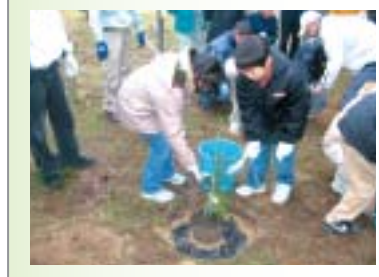
●2世松の植樹式風景

◀松葉、漂着ゴミのボランティア作業を実験的に実施するとともに、シンポジウムやフォーラムなど天橋立の価値付けについても地域とともに開催する等、協働体制の構築に取り組んでいます。