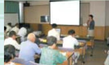
▲安心・安全な生産・加工技術や販売対策等について講義