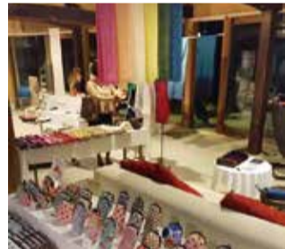
昨年10月の展示会の様子(天橋立)

丹後ちりめんの歴史的・文化的な背景や物語性を活かした織物・シルク関連商品のブランド力強化を図るため、日本遺産のストーリーや構成文化財などの紹介及び多様な織物・シルク関連商品の展示会を行います。