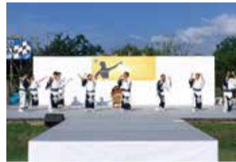
伝統芸能等の公演(イメージ)