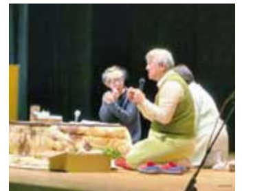
訪問診療の様子を伝える劇