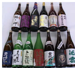
《右》丹後ばらずし《上》丹後の地酒

若手織物事業者と地元高校生とのコラボ企画の実施、着物を着る機会の創出などによる和装振興