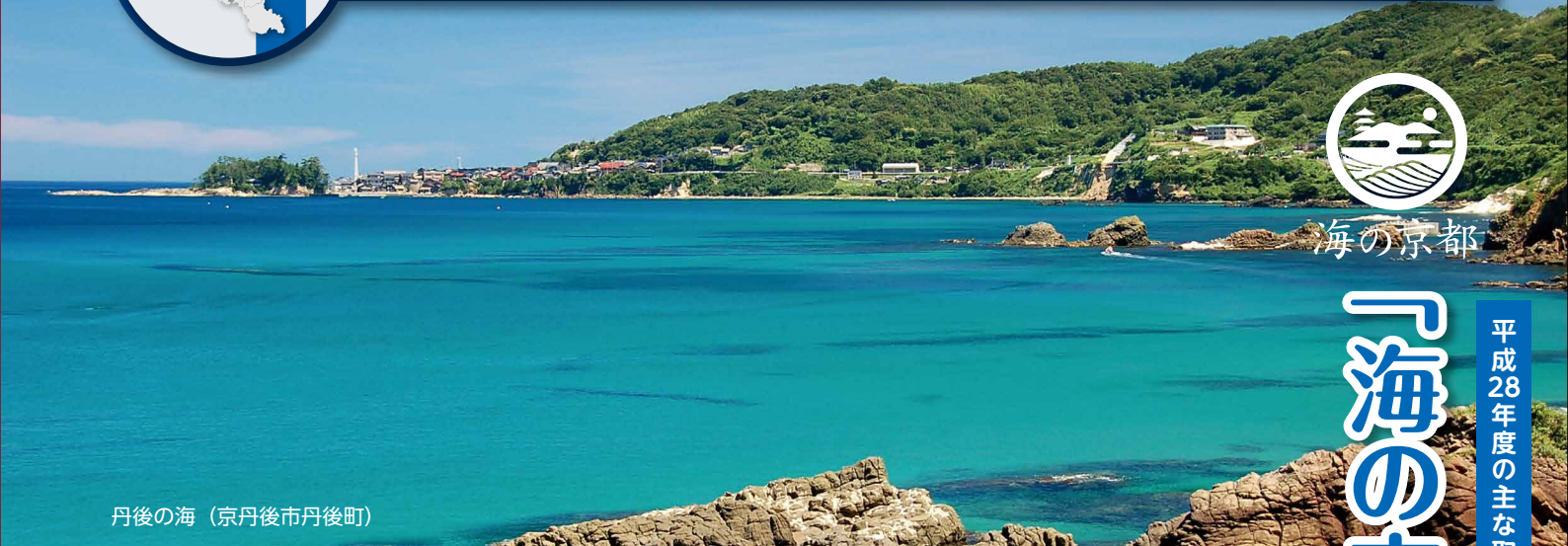
丹後の海（京丹後市丹後町）