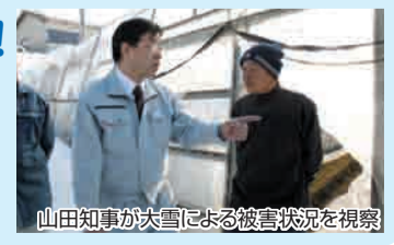
山田知事が大雪による被害状況を視察