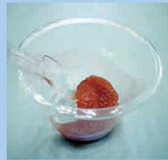
料理やお菓子など幅広く使える梨果汁ソース

丹後・食の王国構想の実現に向け、新しい食材づくりに取り組んでいます。太さそのままで短く育てた「短形ごぼう」や、京たんご梨の規格外品から作った業務用「梨果汁ソース」の商品化に動き出しました。