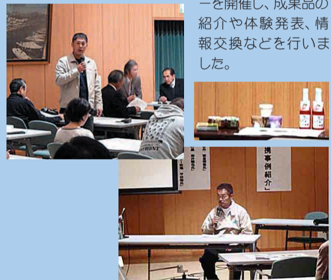
連携関係者によるセミナーの様子

農林水産業者と商工業者の方が、それぞれの強みをいかした農商工連携の取組を推進しています。12月には「丹後あじわいの郷」で丹後地域農商工連携セミナーを開催し、成果品の紹介や体験発表、情報交換などを行いました。