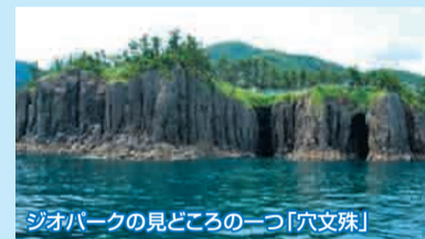
ジオパークの見どころの一つ「穴文珠」

山陰海岸ジオパークや天橋立など丹後の自然、文化、歴史、産業など地域の魅力をいかし、丹後を満喫する旅行商品づくりや情報発信を行います。