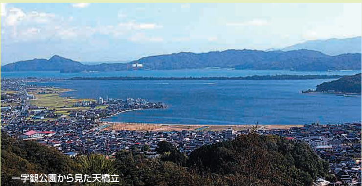
一字観公園から見た天橋立

天橋立の世界文化遺産登録を目指します。さらに国民文化祭をきっかけに、文化活動の活性化を図ります。