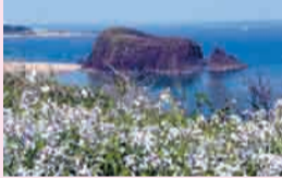
大成古墳から立岩を望む

世界ジオパークネットワークに加盟した山陰海岸ジオパーク。地域の自然や歴史、人々の営みなど、皆さんも魅力を体験、発見しませんか?