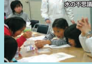
LEDを七色に光らせよう

丹後・知恵のものづくりパークで、子どもたちの科学に対する興味を深め、丹後のものづくりを担う人材育成につなげるため、11月に開催。小・中学生52人が参加。LEDで七色に光るあんどんや、タマネギで染めたエコバッグを製作したり、おいしい水の違いを観察して、科学体験を深めました。