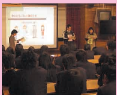
消費生活相談員による出前講座

高校を卒業して新生活を始める皆さんに、悪質商法の被害に遭わない知識と対処法を学んでいただく研修会を開催。