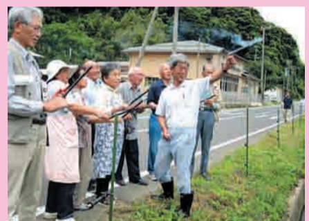
ロケット花火を使ったサルの追い払い講習

野生鳥獣による農林作物の被害対策の効果を上げるため、地域の皆さんと関係機関が協力して対策を進めています。