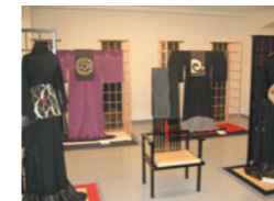
夢ぞしあるキモノ展

和装・洋装の丹後機業グループがデザイナーとのコラボレーションで企画から商品開発までを行い、新たな丹後織物のブランドづくりと販路拡大に向けた取組を実施しています。その一環として和装グループは京都市と東京で、洋装グループは神戸市と東京で展示会を開催しました。