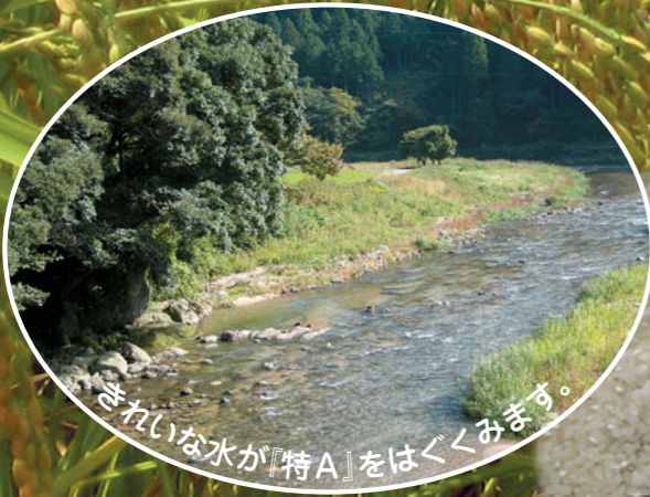
きれいな水が「特A」をはぐくみます。

京都府では、丹後産米の品質向上を目指した研究と技術の普及に取り組むとともに、農業での自立経営を目指した「丹後コシヒカリの里づくり」事業を展開しています。