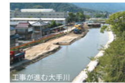
工事が進む大手川

大手川では、『宮津の歴史と自然を生かした安全で心安らく水辺づくり』を目標に、ワークショップなど地域の協力を得ながら、二度と大規模な水害が起きないように抜本的改修を行っています。早期の完成を目指し、景観や生き物に配慮した川づくりを進めています。