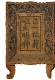
重要文化財「龍神社扁額」(室町時代)

同館では、4月21日(火)~5月31日(日)まで龍神社神幸2500年紀記念として、特別公開「丹後国一宮 龍神社の至宝」展を開催します。国宝「海部氏系図」や重要文化財「龍神社縁塚出土品」、府指定文化財「龍神社文書」などの指定文化財をはじめとする、国内でも類例の少ない貴重な中世神道書ほか社宝を約20年ぶりに一堂に公開します。