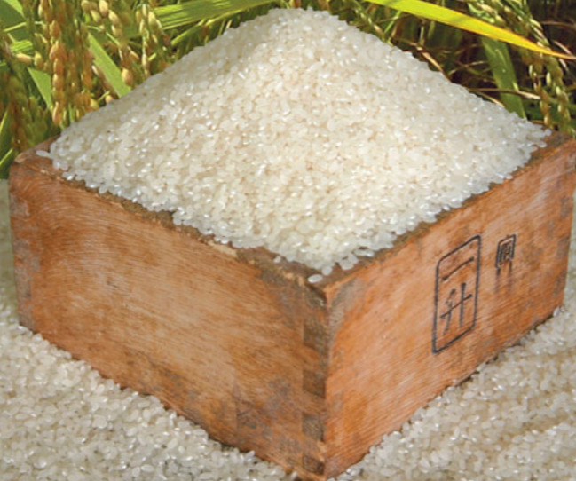
丹後農業改良普及センター ☎0772-62-4308 ☎0772-62-5894