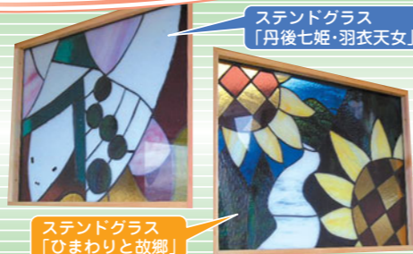
ステンドグラス「丹後七姫・羽衣天女」

大宮ロードパーク(京丹後市)に間伐材を使った「休憩所兼バス停」が完成しました。休憩所は、府立宮津高校(本体)、峰山高校(屋根とステンドグラス)、工業高校(ソーラーパネル、時計)の皆さんがデザインから設置まで取り組まれました。