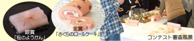
コンテスト審査風景

桜をテーマにした新たな特産品づくりを行うため、料理コンテストを開催。コンテストには、出品された方の思いがふれる作品ばかりで、上位の作品は、今後、商品化に向けた取組が進められます。