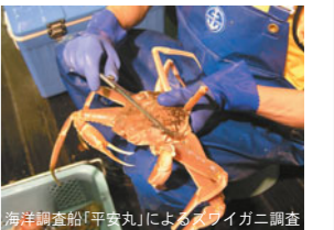
海洋調査船「平安丸」によるズワイガニ調査