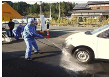
車両消毒ポイントでの消毒