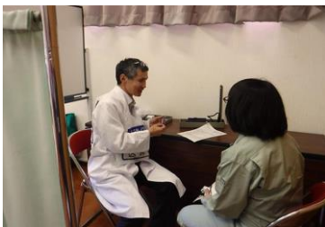
作業前医師による診察