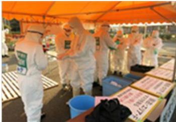
前線基地での消毒と脱衣作業

今シーズンは、青森県、新潟県等、6道県、9農場で高病原性鳥インフルエンザが発生し、(1月27日時点)殺処分等の防疫措置が行われています。また日本各地の野鳥から鳥インフルエンザウイルスが検出されていることから、継続的な監視と防疫体制の維持が重要になっています。鳥インフルエンザ発生時には、迅速な初動防疫対応が必要となることから、今後も訓練を積み重ね各機関との連携を強化し、体制整備を進めていきます。