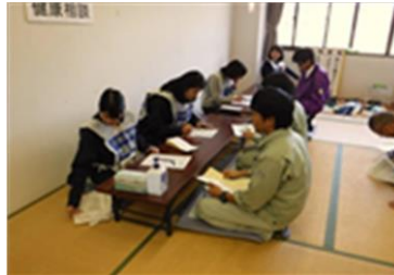
防疫従事者の作業前問診